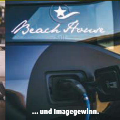
... und Imagegewinn.