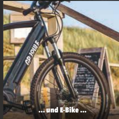
... und E-Bike ...