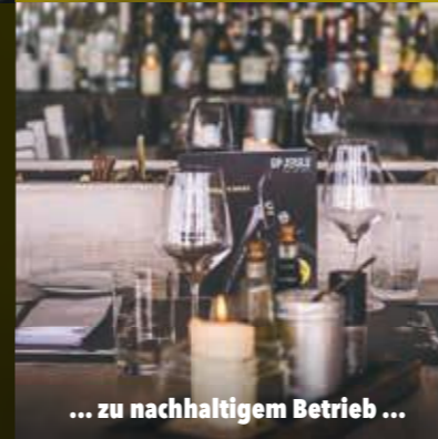
... zu nachhaltigem Betrieb ...

Durch eine ganzheitliche Energiemanagementlösung soll dieser Anteil zukünftig noch deutlich gesteigert werden. Das BeachHouse Sylt strebt das ambitionierte Ziel der autarken Energieversorgung an und setzt auch dabei auf GP JOULE Connect.