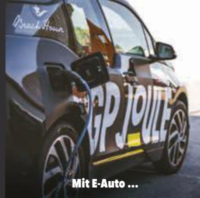
Mit E-Auto ...

Mit GP JOULE Connect hat das BeachHouse ein regional verwurzelttes Unternehmen gefunden, welches dieses Ziel aus Überzeugung unterstützt. 2016 wurden zum Start der Kooperation Solarmodule mit insgesamt 6 kW peak Leistung installiert. Kombiniert mit einem Batteriespeicher und komplettiert durch den Bezug von 100 % CONNECT Strom aus regenerativen Quellen ist die nachhaltige Stromversorgung des Restaurantbetriebes gesichert. Über die aktuellen Leistungsdaten der Solaranlage informiert ein Display im Eingangsbereich des Restaurants. Der Gast ist also immer live dabei und der regenerative Versorgungsansatz des BeachHouses wird imagewirksam kommuniziert.