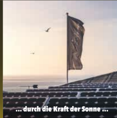
... durch die Kraft der Sonne ...