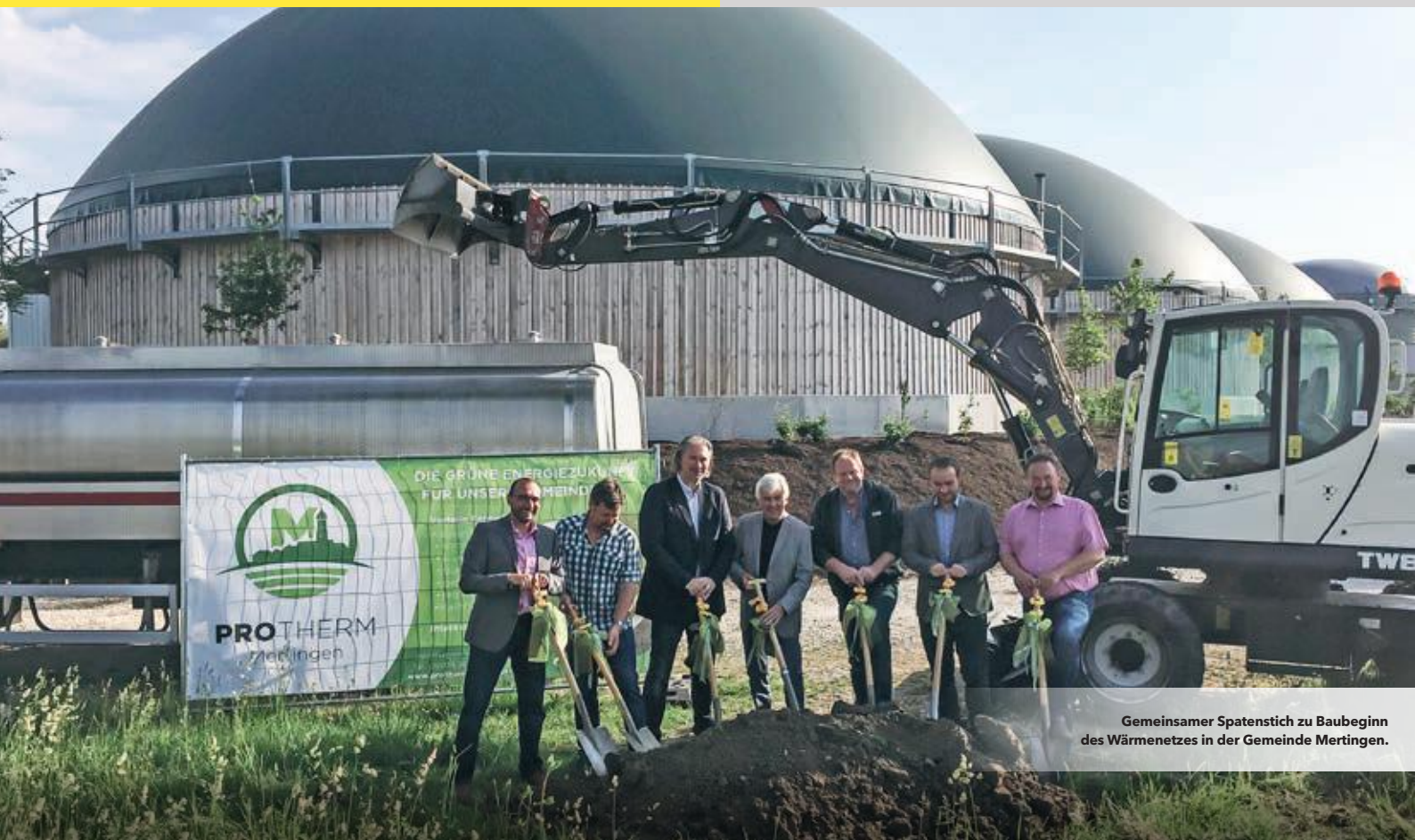
Gemeinsamer Spatenstich zu Baubeginn des Wärmenetzes in der Gemeinde Mertingen.

Geschäftsbereiche: PROJECTS, PRODUCTS & SERVICES, THINK, CONNECT